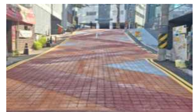
[제한속도 하향(20km/h) 및 보행친화 포장]