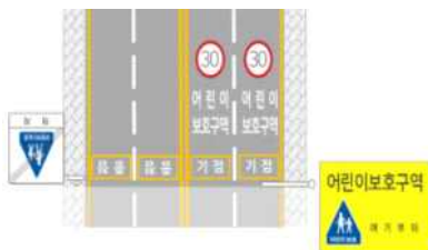
[어린이 보호구역 지정]

▶ 보도 폭 확보가 어려울 경우, 제한속도 하향(20km/h) 및 보행친화 포장 : ’26년 17개소