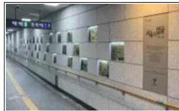
시민청 입구 「명예의 전당」 전경