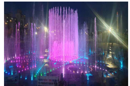
〈 뚝섬 음악분수 〉