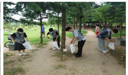
〈 쓰레기 줄기 캠페인 〉