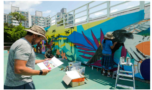
〈한-콜롬비아 문화교류 활동(벽화 조성)〉