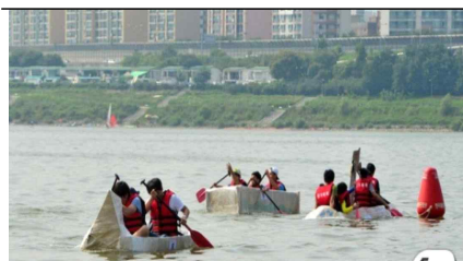
<한강 이색 배 레이스>