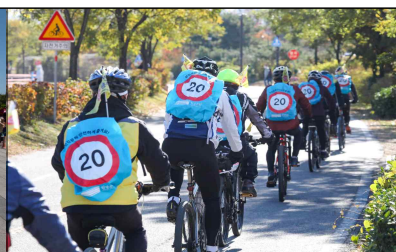
〈자전거 패트롤 봉사단〉