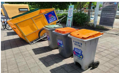
〈 음식물 수거용기 〉