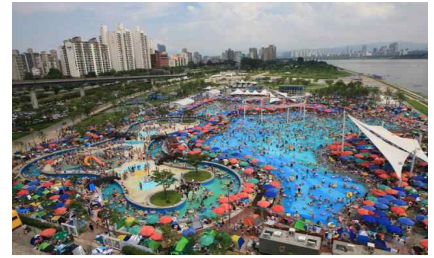
〈 뚝섬 수영장 〉