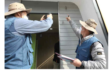
〈시설물 현장 점검〉