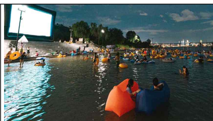
<한강 필름 페스티벌>