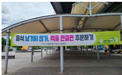
〈 음식물 쓰레기 감량 현수막 〉