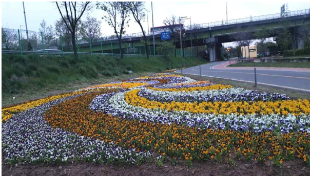
〈 봄꽃-가로화단(양화) 〉