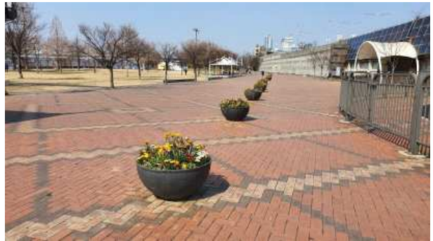
〈 봄꽃-원형화분(독섬) 〉