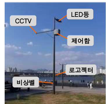
〈여의도 스마트폴 설치〉