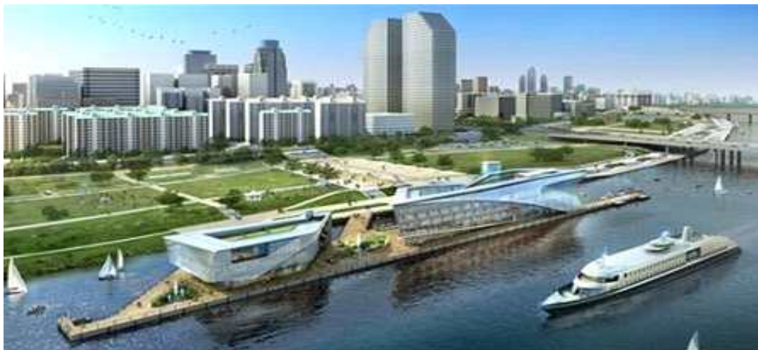
<한강 수상관광호텔 조감도>