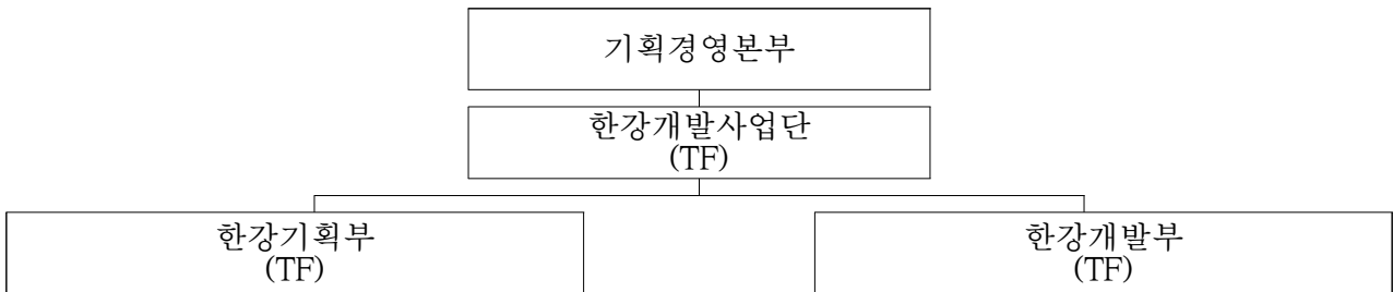
표5)하였고, 곧이어 SH공사 사장 지시6)에 따라 공사 내부 검토과정을 거쳐 2023년 6월 ‘한강개발사업단 TF’조직이 신설7)되었음.