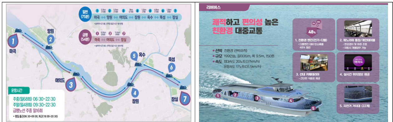
출처 : 새로운 수상 대중교통 시대를 열다, 한강리버버스, 2024.2.1., 서울시 미래한강본부 발표자료

- 이 사업은 마곡에서 잠실까지 총 거리 31.5km에 걸쳐 선착장 7개소 (마곡, 망원, 여의도, 잠원, 옥수, 뚝섬, 잠실)를 조성하고, 시민을 위한 대중 교통 및 관광수단으로 150톤급 선박 8척을 도입 11) · 운영할 계획으로, SH공사는 민간기업((주)이크루즈)과 함께 가칭 “한강리버버스 주식회사” 를 설립하여 리버버스를 소유· 운영할 예정이며, 이를 위해 총 51억 원 을 출자하고자 이번 제322회 임시회에 “서울주택도시공사 한강 리버버 스 출자 시행 동의안”(의안번호 1645)을 제출하였음.