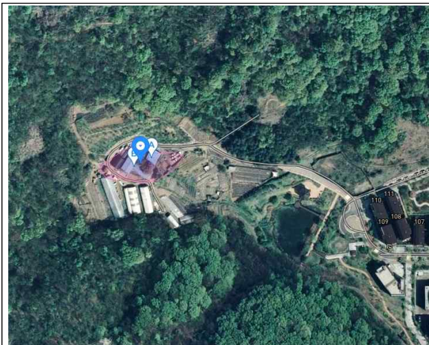
천왕동 173번지 일원 항공사진