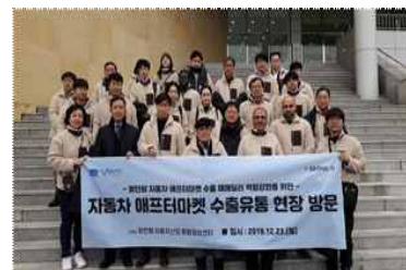
〈수출지원 교육, 현장방문〉