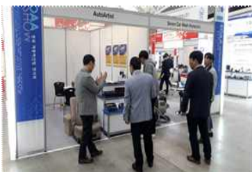
〈기업 차량전시회 부스지원〉