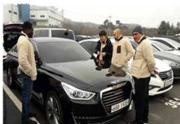
〈국내외 바이어 발굴〉