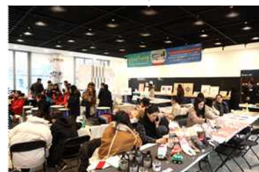
〈카메이커스 시민체험 교육〉