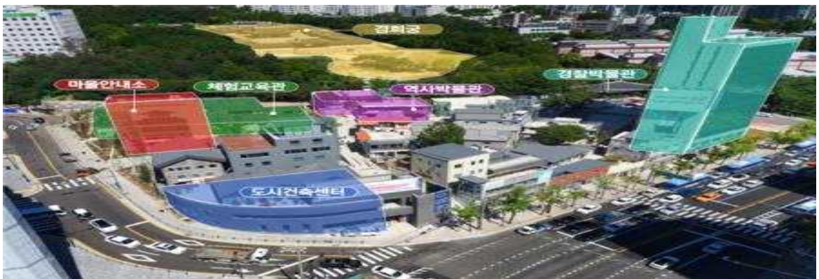
< 돈의문박물관마을 전경 >