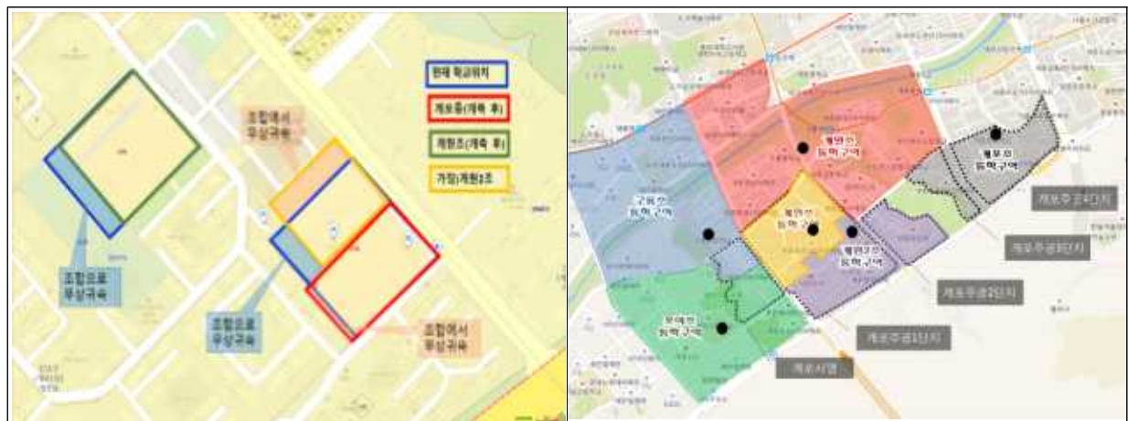
<위치도 및 현황도>