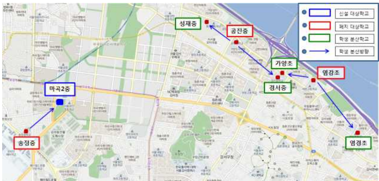
[그림-2] 마곡2중 설립에 따른 분산배치도