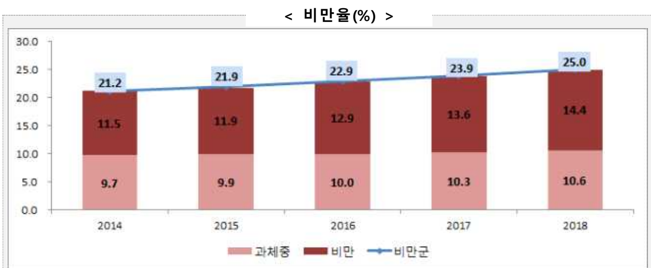
[표-1] 비만학생 비율