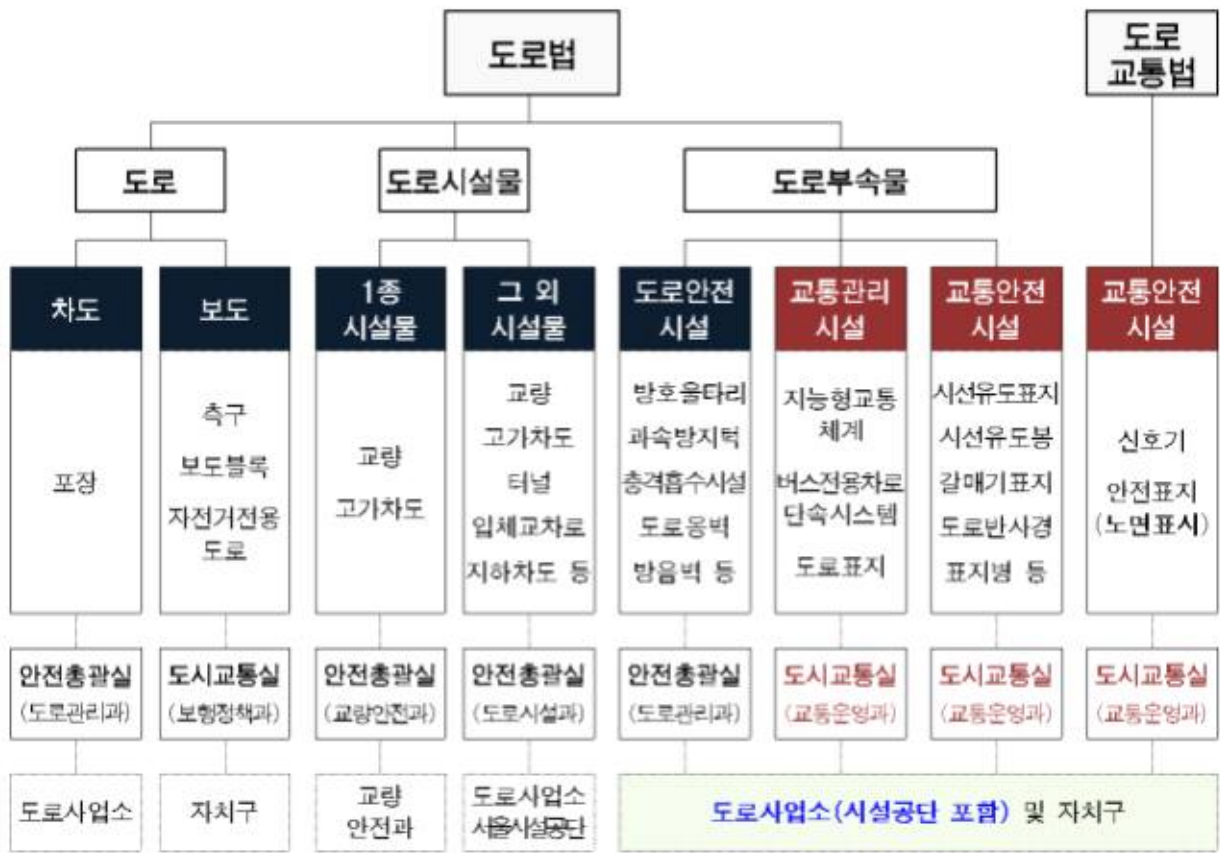
[그림] 현행 서울시 도로 및 교통시설 관리체계