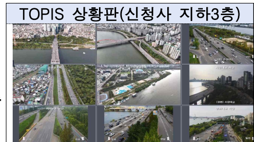
TOPIS 상황판(신청사 지하3층)