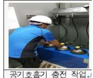
공기호흡기 충전 작업