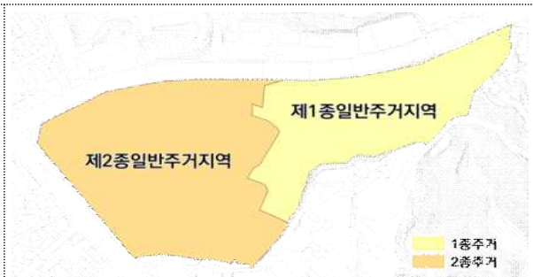
< 용도지역 현황 >