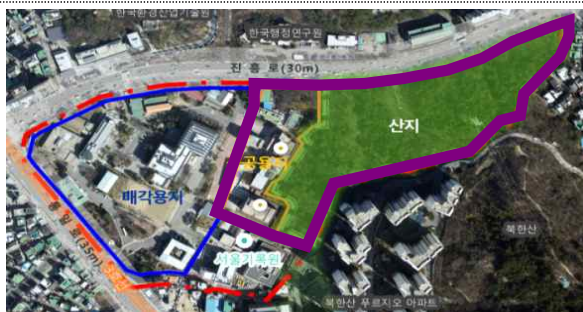
< 위 치 도 >