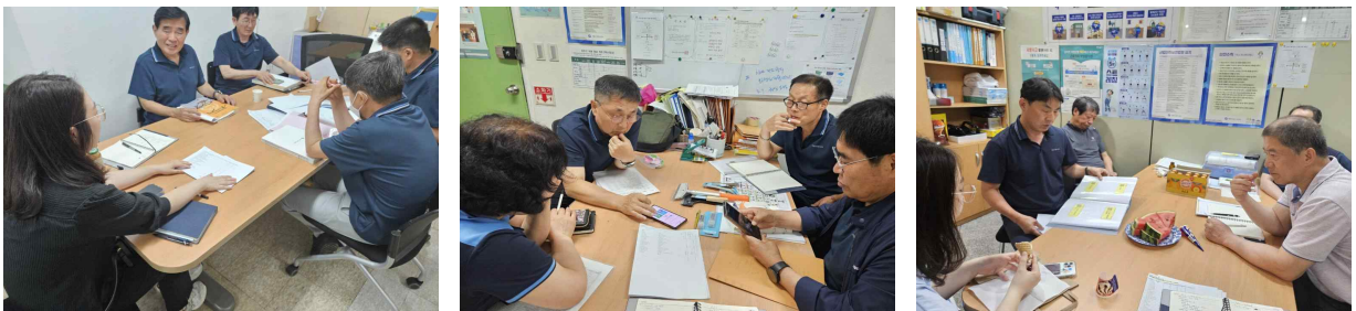
<재고관리시스템 현장 안정화를 위한 실무협약>