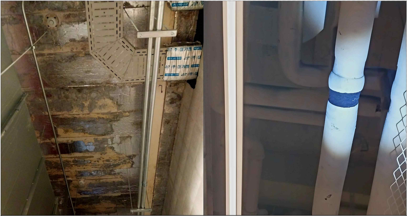
< 누수 및 실내습도 불량으로 인한 하자 발생 사진 >

그러나 서울시립미술관은 현재까지 파악된 총 640건의 하자보수 요청에 대한 진행 현황을 명확히 관리하지 못하고 있으며, 하자보수의 책임이 있는 서울시 도시기반시설본부는 전반적인 처리에 미온적인 상황임.