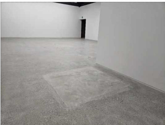
< 전시관 바닥 색상 편차 발생 사진 >

또한 광장 출입구의 물고임 현상 역시 배수에 관한 명확한 법적 기준 부재와 설계도서 준수 여부를 이유로 하자가 아닌 것으로 판정되었음.