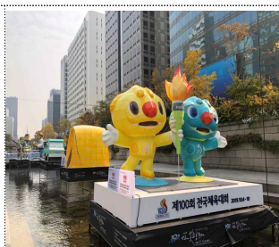
빛초롱축제 마스코트 燈