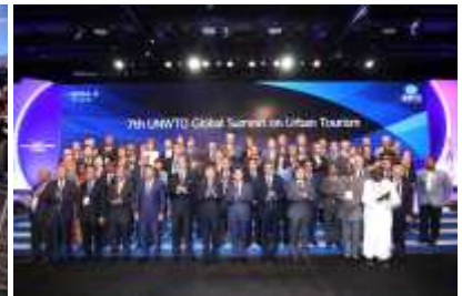
제7차 세계도시관광총회 (9.16~19)