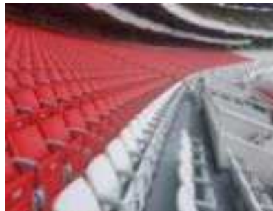
〈잠실주경기장 2층 관람석 교체〉