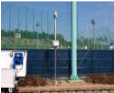
〈구의야구공원 CCTV 설치〉