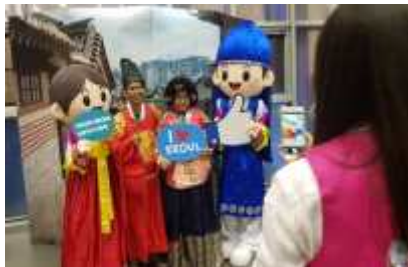
인센티브관광 단체 포토월 (인도네시아 타파웨어 그룹)