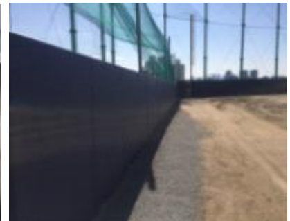
〈구의야구공원 안전펜스 설치〉