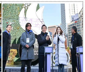
카운트 다운 시계탑 제막식