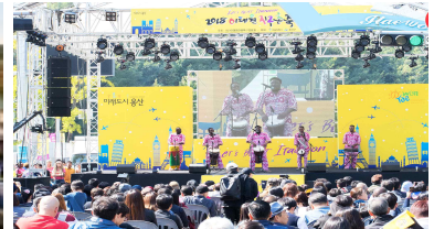
〈이태원 관광특구 지구촌 축제〉