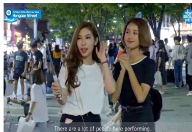
〈인플루언서 활용 마케팅〉