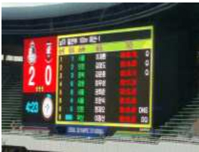
〈잠실주경기장 전광판 교체〉