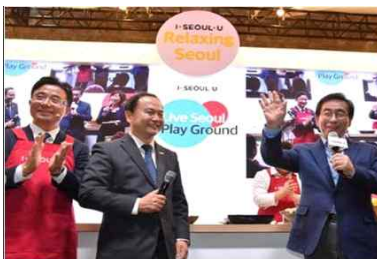
〈중국 체험부스 운영〉