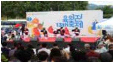
〈종로·청계 관광특구 유익진 축제〉

— 대표축제 개최 및 안내지도, 홍보물 제작 등을 위한 사업비 지원(480백만원)