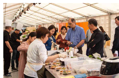
〈브뤼셀 음식축제 참가 홍보〉