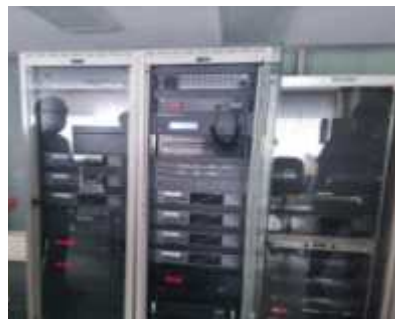
〈잠실종합운동장 비상방송 설비 설치〉