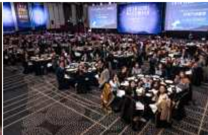
'18년 서울 MICE WEEK (11.22~23)