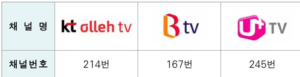
<표 6> IPTV 교통방송 채널번호 현황

또한 ‘서울특별시 책임운영기관 2015년도 운영실적 평가보고서 ((주)한국경제경영연구원, 2016)’에서 “교통방송은 인지도를 높일 수 있는 다양한 방법의 노력이 강구되어야 한다”는 지적이 계속되었으나 재단 설립으로 인지도 상승이 가능하다고 볼 수 있는 면밀한 계획은 찾아 볼 수 없음.