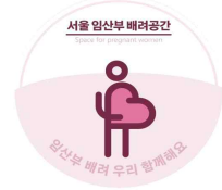
임산부 배려공간 디자인