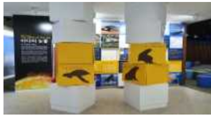
소중해 해양생태 교육장