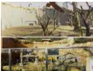
유인원관 전경 및 컨셉