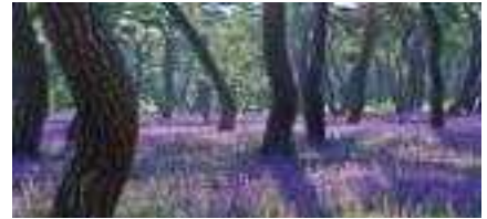
맥문동 식재 소나무림(안)