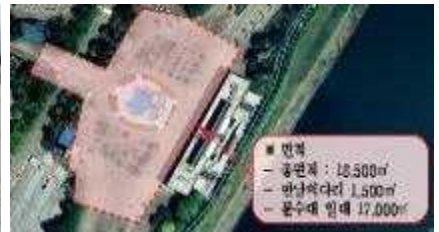
노후 분수대 현황