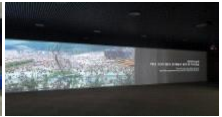
소중해 영상자료 상영관