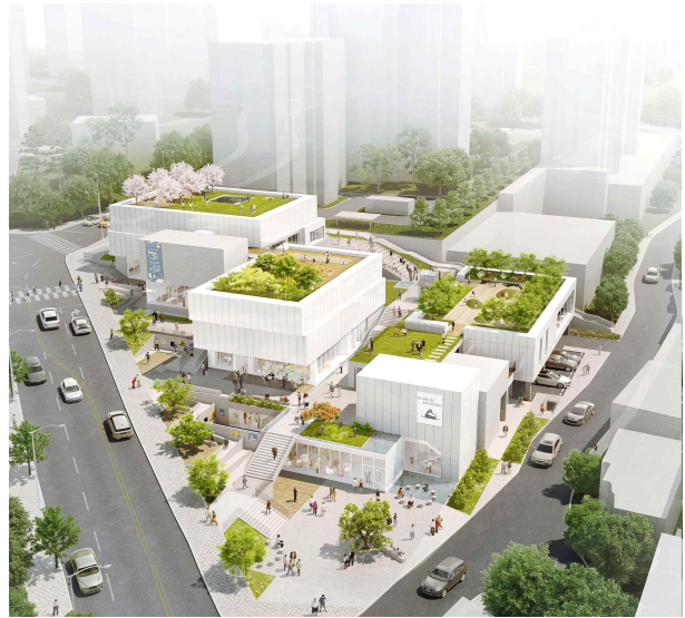
▲ 동북권 아동·청소년예술교육센터