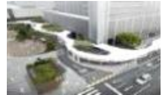
▲ 공공로 UD적용(가산디지털단지역)

▶ 적용 대상지(1개소) : 금천구 가산디지털단지역 일대 (공공가로 170m, 공개공지 432m 2 )