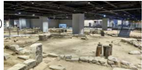
〈공평도시유적전시관 내부 전경〉

▶ '강동구 문화유적 지표조사 및 보존방안 연구' 학술용역 완료('18. 12월)