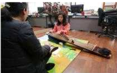
▲저소득층 예술영재 교육