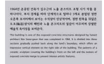
▲ 일러스트 엽서, 리플릿, 설명동판