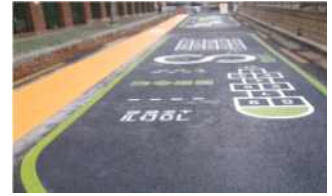
▲ 어두운 사각지대 개선(양천구)