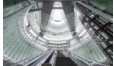
▲ 녹사평역 공공미술프로젝트