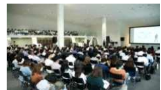
▲ UD 국제세미나

▶ 초등교사 교육 및 초등학생 5,6학년 대상 체험교육 실시(교사167명, 168학급 3,874명)