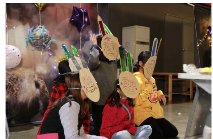
▲꿈다락 토요일문화학교 운영