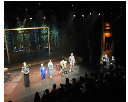
▲장애인극단 활동 지원