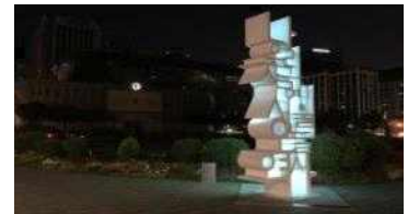
▲ 서울광장 '우리의 빛'