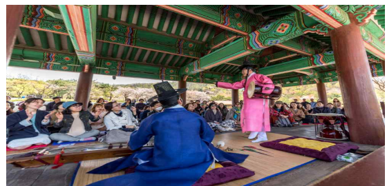
▲남산국악당 '젊은국악 도시락'