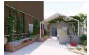
▲인자점내 100세 정원 조성(금천구)