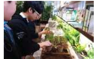
▲ 식물활용 공간 조성(전일중)