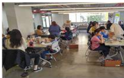
▲장애청소년 미술교육 지원