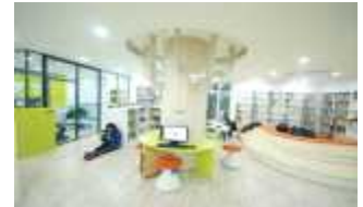
▲ 어린이 도서관 UD 컨설팅(금천구)

▶ 적용 대상지(4개소) : 서울애니메이션센터, 근로자문화복지센터, 상도1동 경로당, 동작 어르신복지관