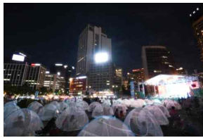
▲ 서울 문화로 바캉스