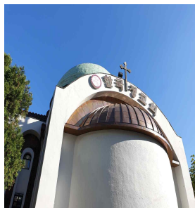
▲ '성니콜라스 대성당' 돔 공사(전, 후)