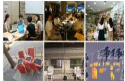
▶ 대학협력 공공미술

▶ 공모('18.5월)를 통해 6개 대학 8개 팀 선정(국민대, 동국대, 동덕여대, 성신여대, 송실대, 홍익대) ▶ 참여대학 워크숍 실시('18.5~10월), 현장전시 투어('18.9~10월), 성과 발표회('18.10.31)