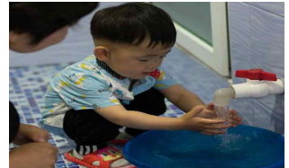
◀UN 북한필요와위생위 보고서▶