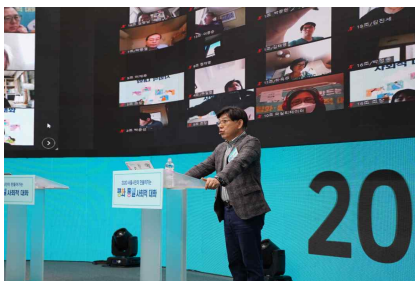
〈전문가 발제 및 질의응답〉