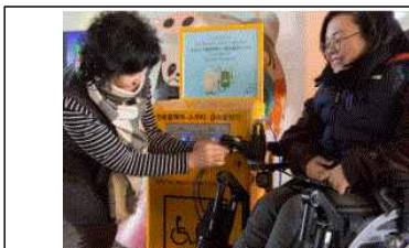
<전동휠체어 급속충전기 설치 지원_365MC>