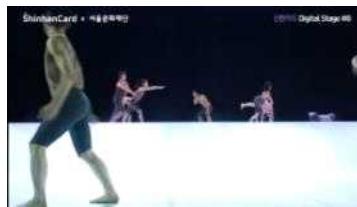
<언택트 공연 영상제작 지원 사업_신한카드>