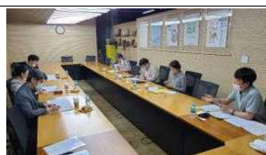
연구과제 심의위원회 개최