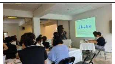
<서울문화지표조사> 미리읽기 세미나