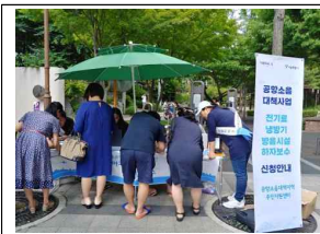
소음대책사업 현장 안내