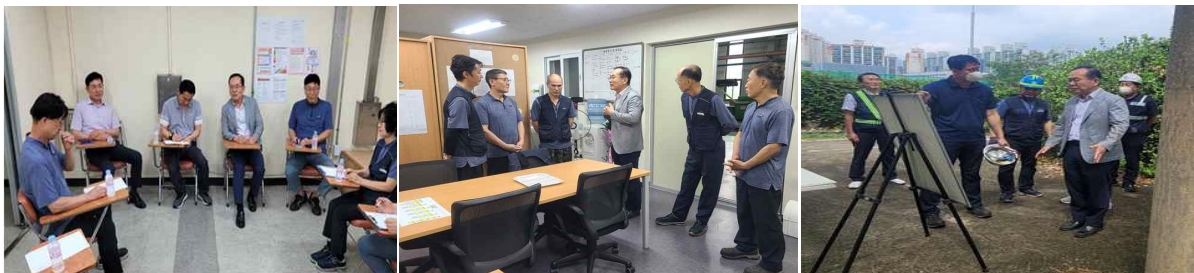
< 현장 방문 및 업무 참관 >