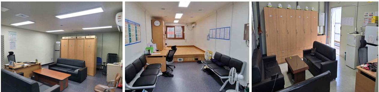
< 전동차 기타청소 직원 휴게공간 >