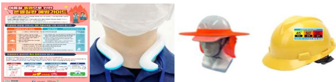
< 폭염대비 안전용품 및 예방수칙 >