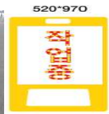
<스카이차 임차·운용 도로안전 확보 >