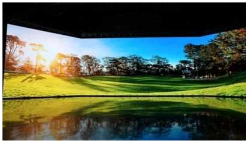
< XR 스튜디오(조성예시) >