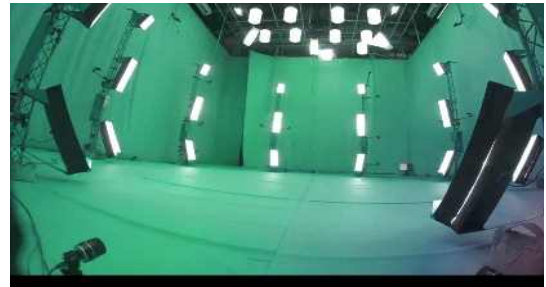
< VFX 스튜디오(조성예시) >

※XR스튜디오 : LED Wall을 이용한 확장형 실감 영상 제작 스튜디오