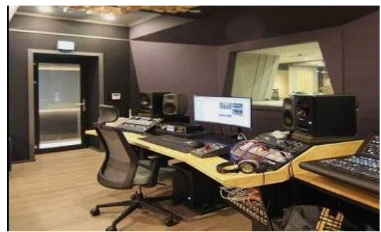
< 녹음 스튜디오(조성예시) >