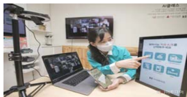
키오스크 사용 원격교육