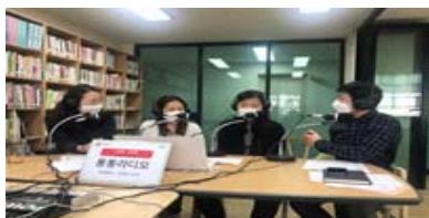
온라인 콘텐츠 제작시스템