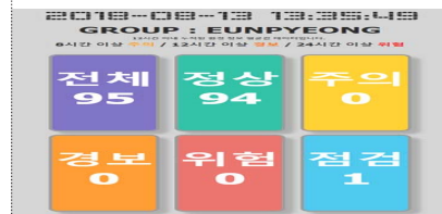
IoT 안전관리솔루션 모니터링