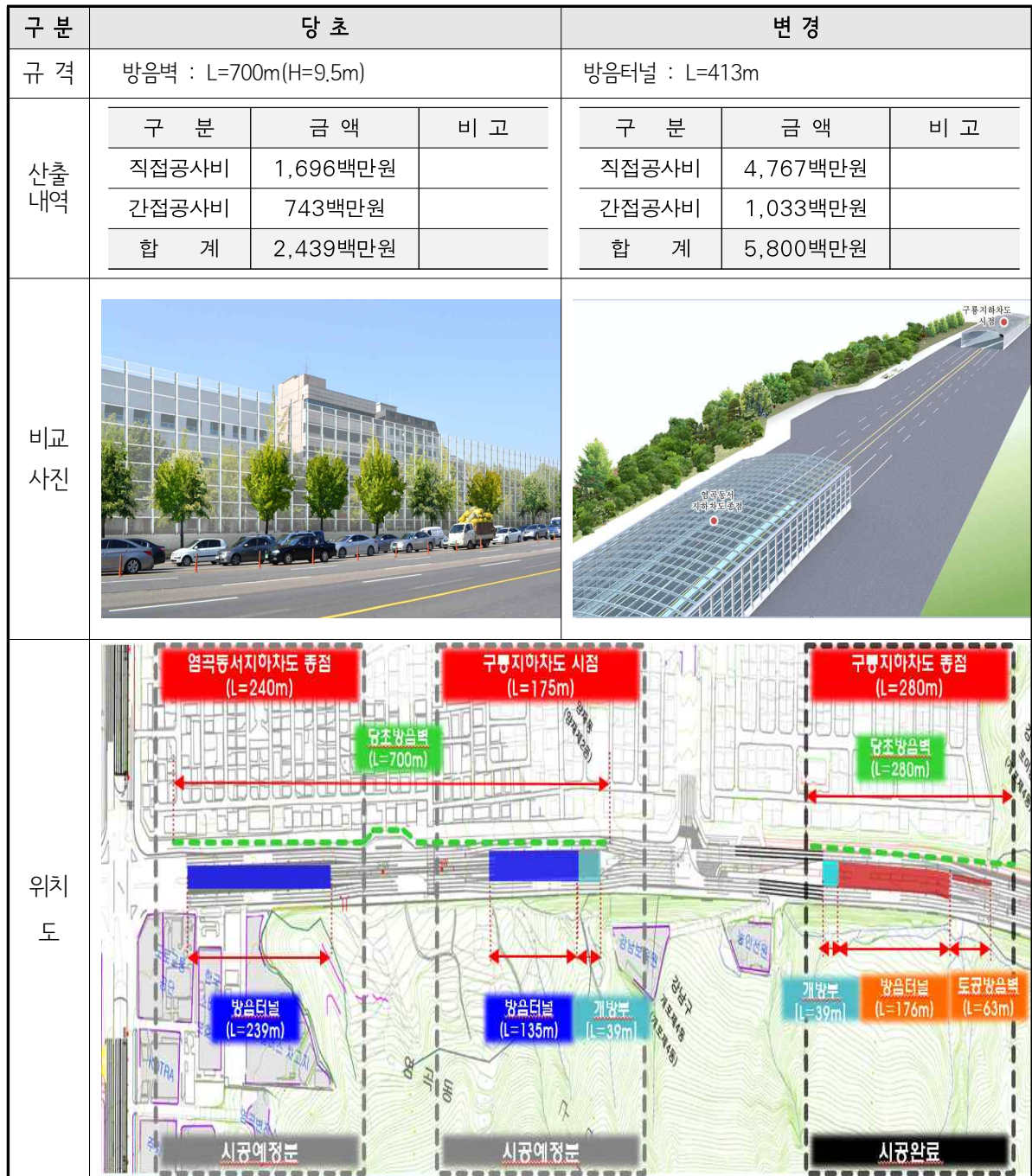
[표] 방음시설공사 변경내역