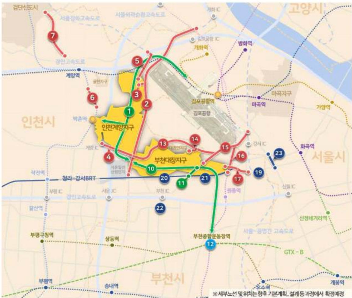
[그림] 인천계양 및 부천대장 광역교통개선대책