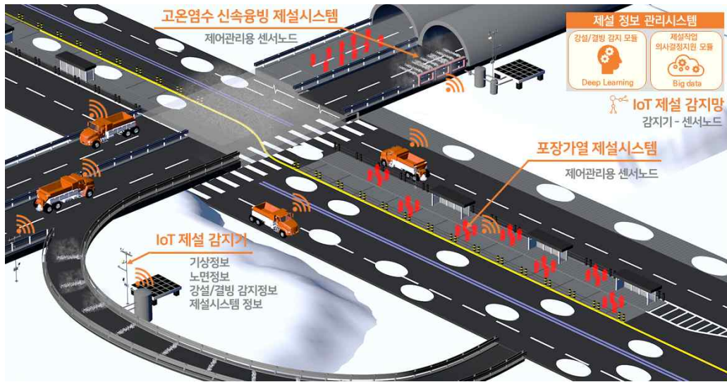
IoT 기반 친환경 제설시스템 개념도