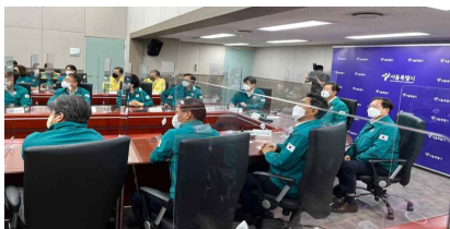
〈전시종합상황실 최초 상황보고〉