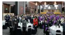
〈여군창설 72주년 기념행사〉