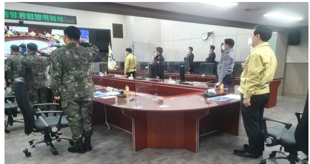
< 중앙통합방위회의 >