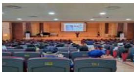
〈6.25전쟁 72주년 기념행사〉