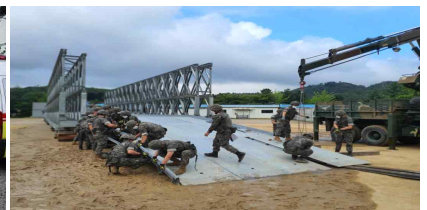
〈한강교량 긴급복구 훈련〉