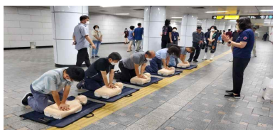
〈생활안전 교육 : 심폐소생술〉