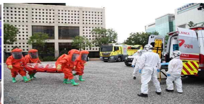
〈철도 관제시스템 테러대응 훈련〉