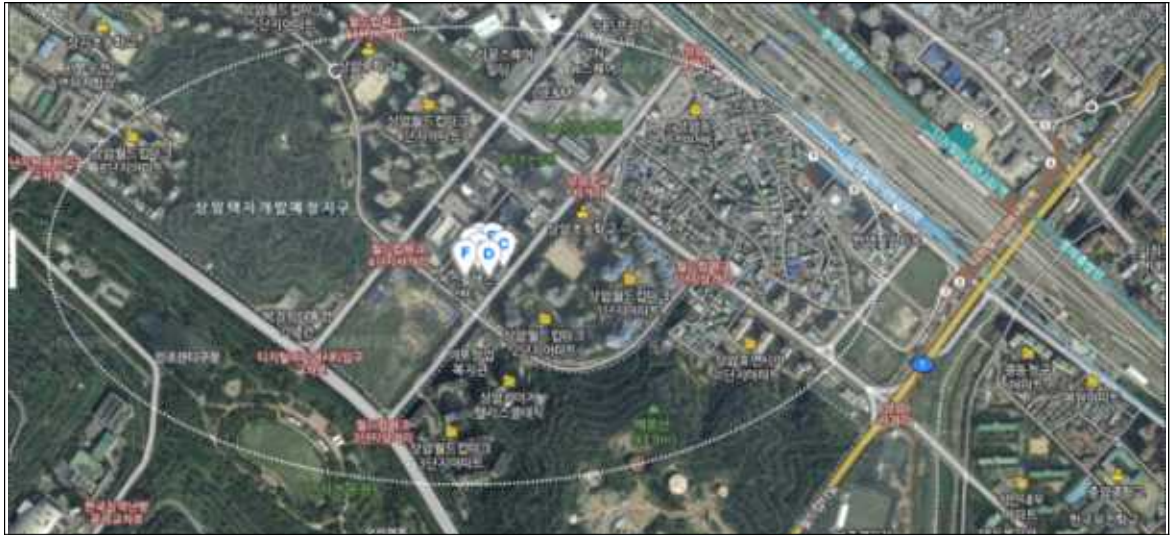
지역여건 | 지하철 디지털미디어시티역(경의중앙선, 공항철도, 6호선)에서 도보 15분