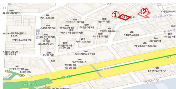
〈창업꿈터 2호점, 10m인근 위치〉