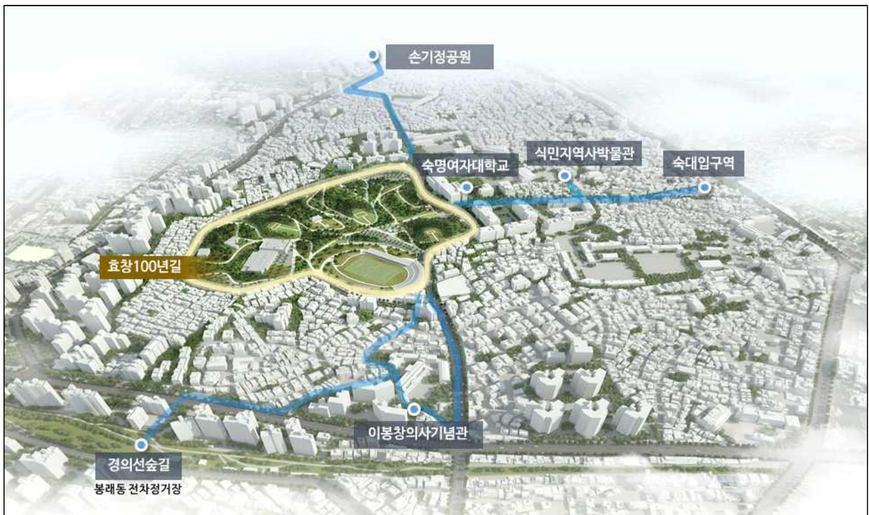
〈효창독립 100년공원 기본구상(안)〉