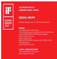
【 iF 디자인 어워드 본상 】