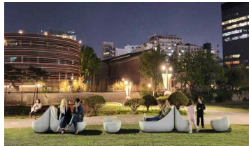
【 열린송현녹지광장 시민 이용 모습 】