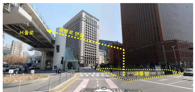
서울스퀘어 앞 교통섬 (서울로7017 연결로 구상)