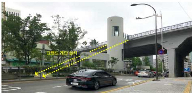
남산육교 (그랜드 계단 구상)

사전 검토와 관련부서 협의 등을 통해 사업이 기획된 후 예산을 편성해야 함에도, 이 사업은 예산을 먼저 편성한 후 사업을 계획하는 과정에서 사업 가능성이 낮아 해당 예산을 감추경하는 사안으로서 재정 운용의 비효율성을 초래한 바, 예산 편성의 사전 절차 이행에 주의가 요구된다 하겠음.