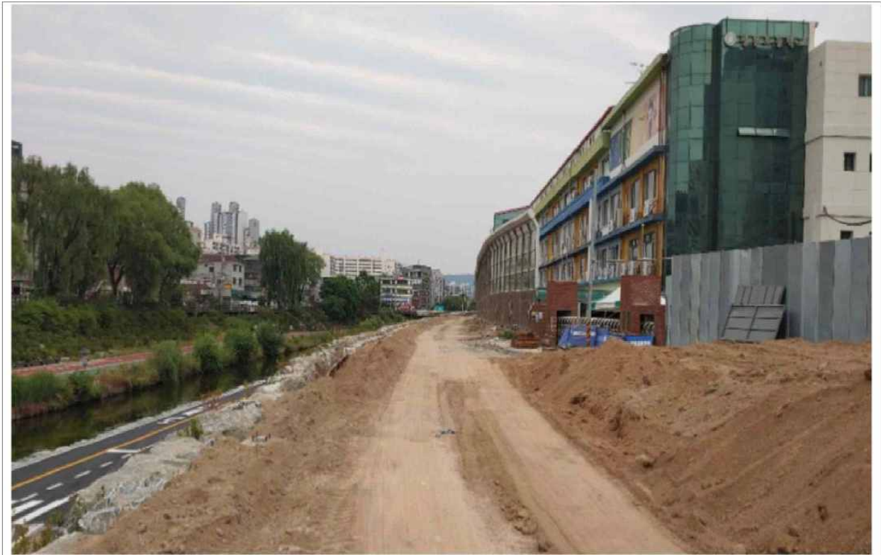
[그림 1] 우이천(성북구) 복개구간 철거현황