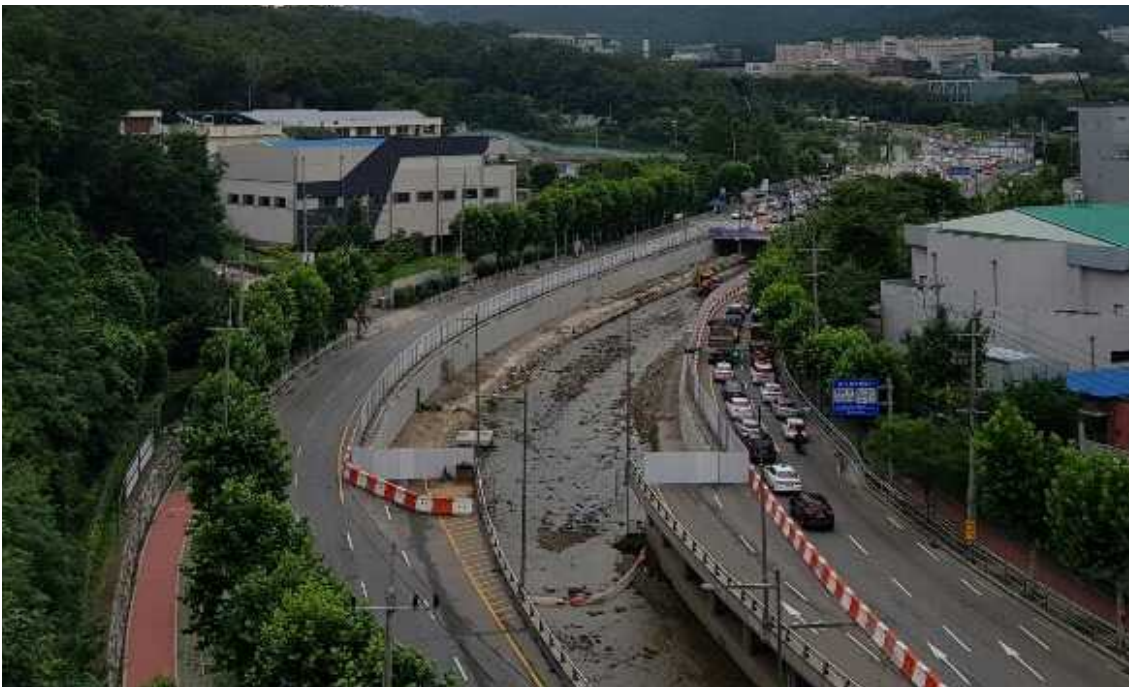
[그림 1] 도림천(관악구) 복개구간 철거현황