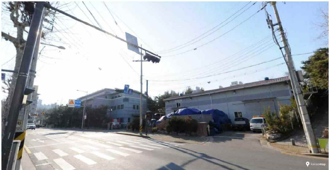
[그림 2] 중화빛물펌프장 위치 및 현황