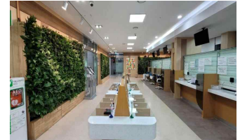
[공기질 개선 식물활용 공간]