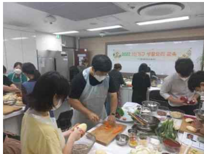
[1인 가구 생활요리 교육]