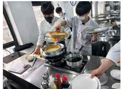
[우리 쌀 이용 전문교육]