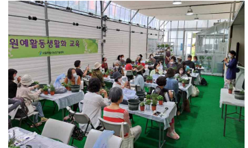
[원예활동 생활화 교육]