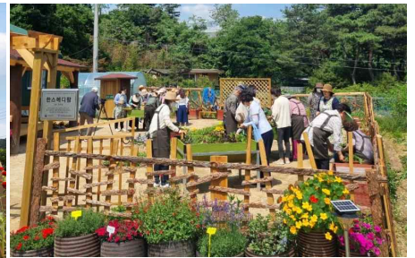
보급형 치유농장 운영지원