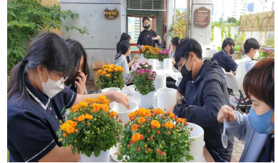
[중학교 자유학기제 학교텃밭]