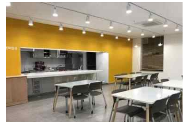
〈대방동 마을활력소內 공유부엌〉