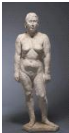
<나부>, 1953, 석고, 167×63.7×35cm, 국립현대미술관 소장