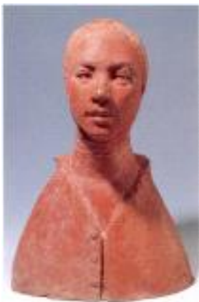
<지원의 얼굴>, 1967, 테라코타, 49x32x27cm, 개인 소장