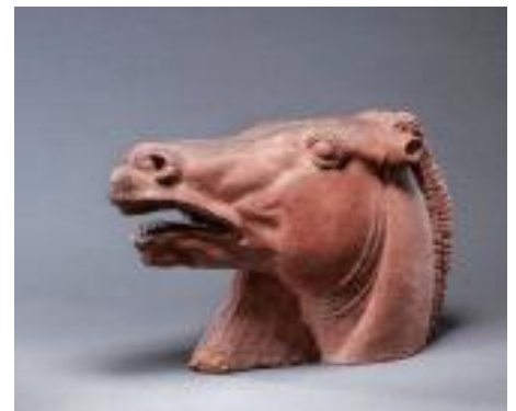
<말>, 1969, 테라코타, 34x58x20cm, 국립현대미술관 소장