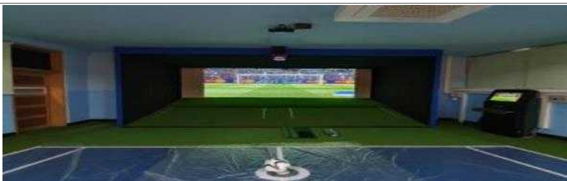
사당초등학교 설치 사례

코로나19, 미세먼지 등 외부환경으로 생활체육활동의 어려움이 있는 상황에서 가상현실 스포츠실 확충을 통해 생활체육 참여를 유도해 볼 수 있을 것으로 판단됨.