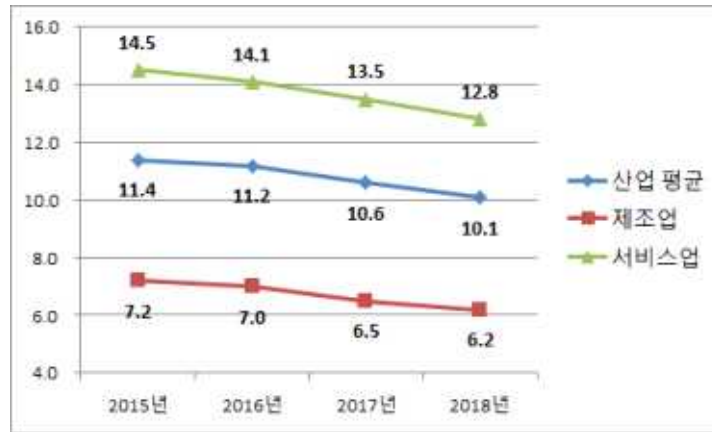
〈그림 -1〉 취업유발계수 변화 추이(2015~2018년)