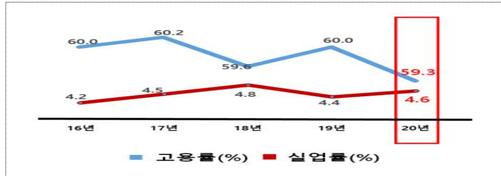
〈그림-3〉 최근 5년 간 서울시 고용 및 실업률