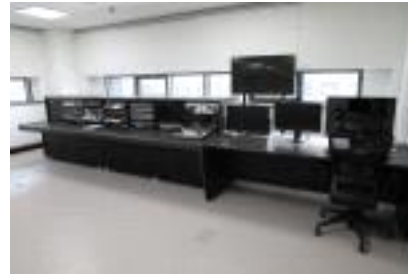
〈 시청각 기록물 복원실〉