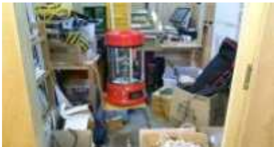
< 물품 보관창고 일부 >