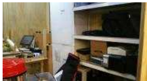
< 물품 창고선반>