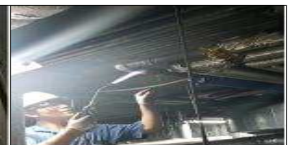
[환기실 시수배관 누수 복구]