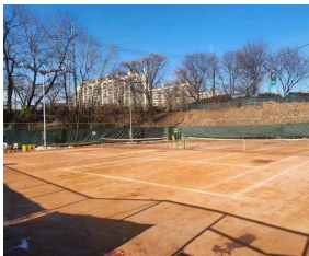
< 동부도로사업소 >