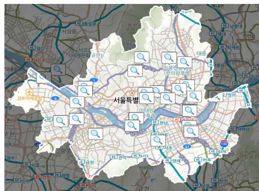
[그림] 공공서비스 예약시스템에 등록된 테니스장