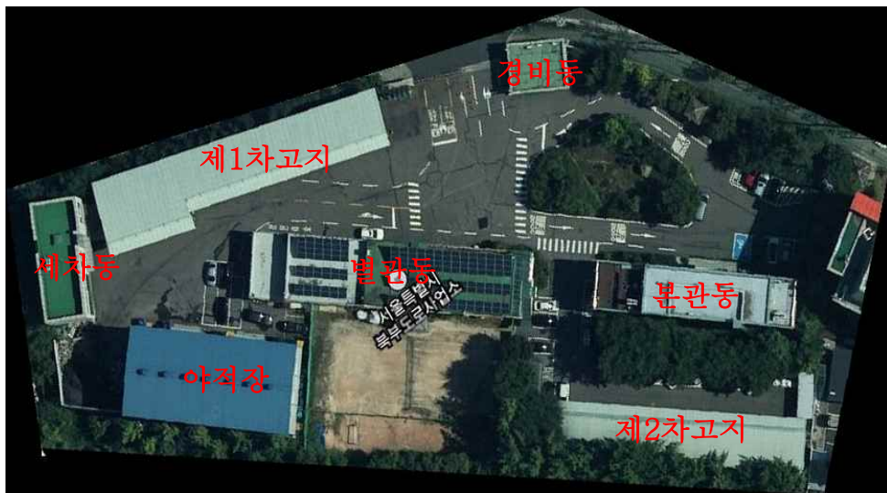
[그림] 북부도로사업소 전경