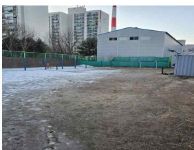
< 북부도로사업소 >