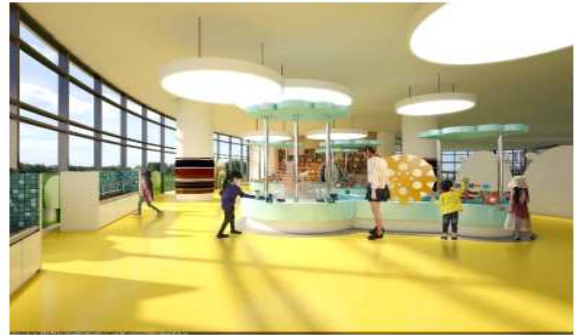
별난 물 놀이터