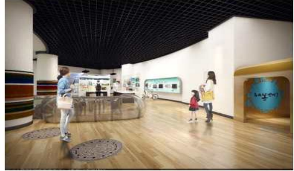
다시 깨끗해지는 물