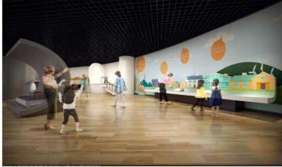
돌고 도는 물