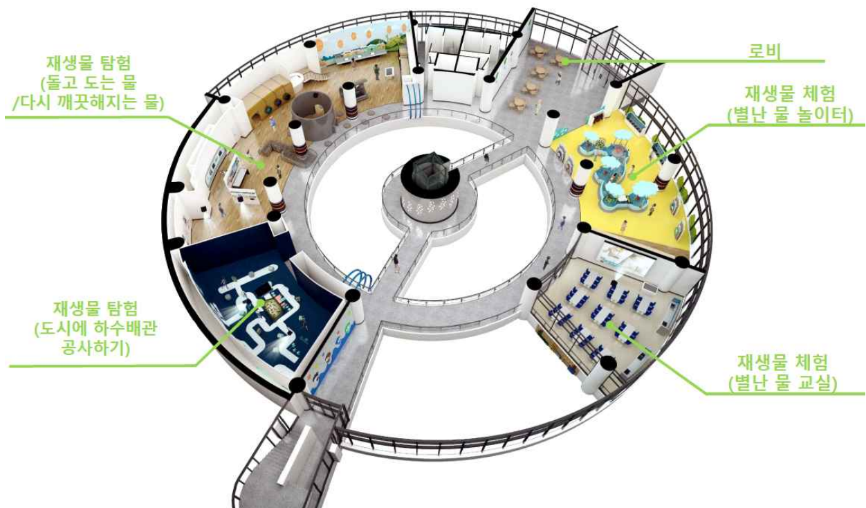
4-3. 2층 전시완성예상도