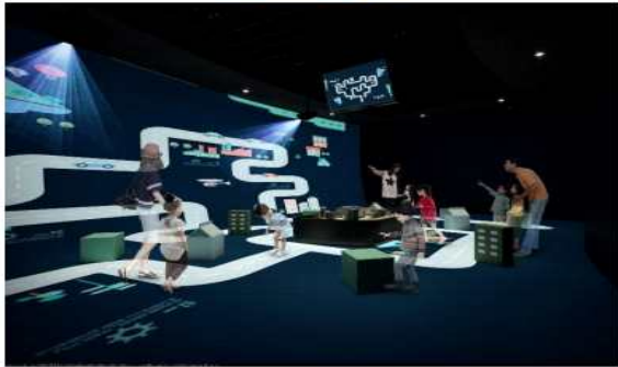
도시에 하수배관 공사하기