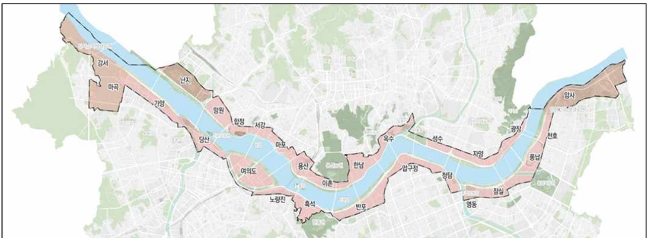
〈한강수변 주요 공간범위〉

- 현재 한강을 중심으로 개별사업들이 진행되고 있는 가운데, 도시계획국에서는 “그레이트 선셋 프로젝트”의 일환으로 지난 2015년 수립한 “한강변 관리 기본계획”을 수정·보완하는 “한강변 공간구상”용역을 진행(2022. 6. ~ 2023. 9.)하고 있는데, 미래공간기획관에서는 도시계획국 용역이 준공되기 전 ‘공간기획 및 세부실행전략’을 동시에 수립할 계획이므로, 두 부서 간의 긴밀한 협조와 정보공유를 바탕으로 효율적인 사업추진을 도모해야 할 것임.