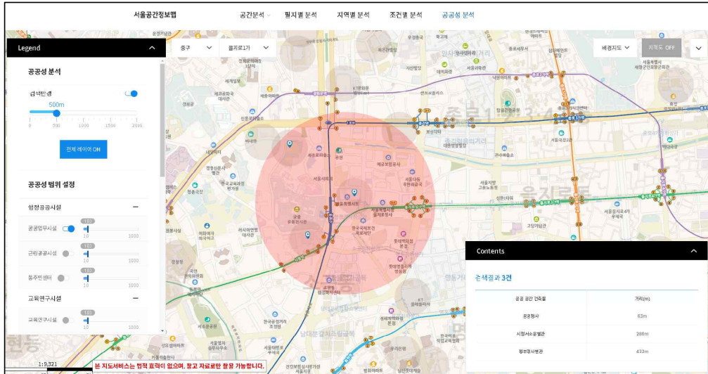
〈서울 공간정보맵 홈페이지 ( https://space.seoul.go.kr )〉