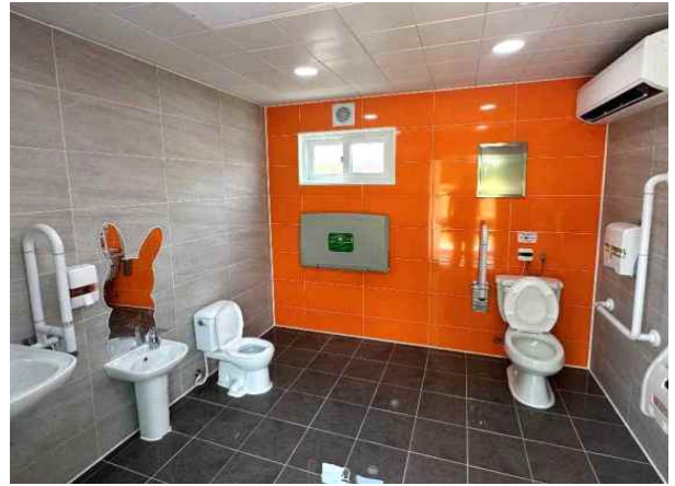
가족 화장실 내부