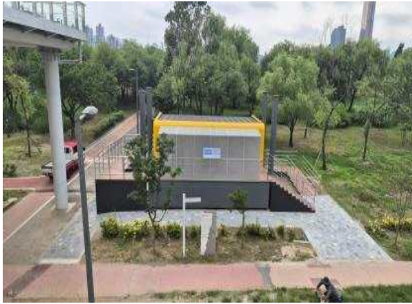
이촌 부상형 화장실