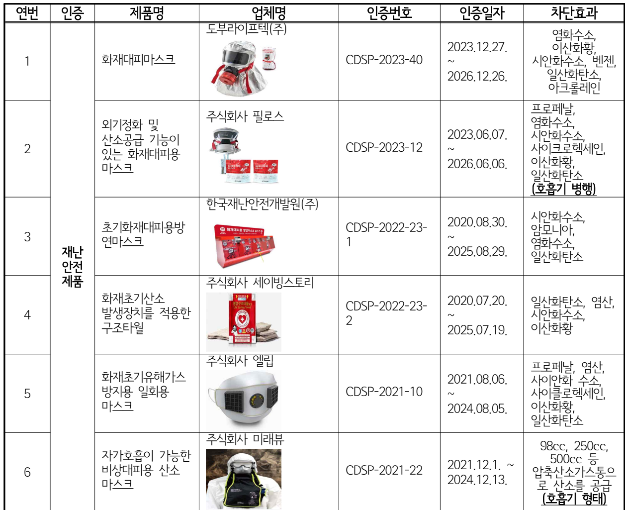
[표] 화재대피용 방연마스크 재난안전제품 인증 현황(‘24.2 기준, 재난안전산업종합정보시스템)