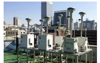
< 미세먼지 상세 모니터링 >