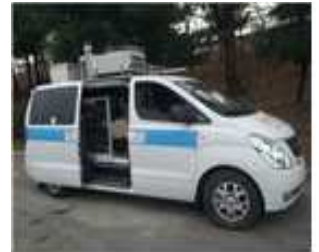
< 악취 이동측정차량 >