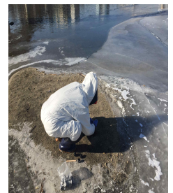
< 철새분변 채취 >