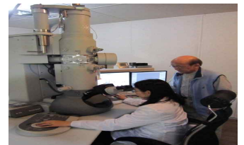
< NVLAP 정도관리 >