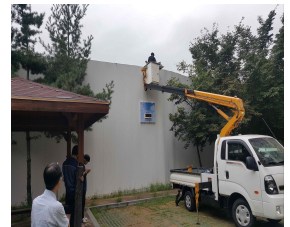
< 공사장 소음 모니터링 >