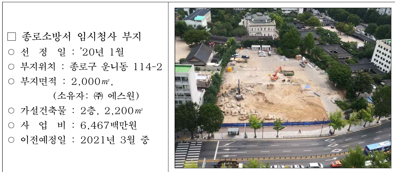
[표] 종로소방서 임시청사 부지(1순위, 운니동주차장) 전경